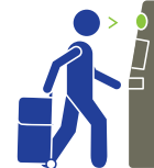
CHECK-IN DE AUTOSERVICIO