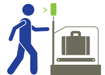
AUTOSERVICIO DE ENTREGA DE EQUIPAJE