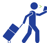
CHECK-IN CON EL CELULAR

Estamos desarrollando nuestras capacidades de gestión de identidad y aplicándolas completamente en el viaje de los pasajeros.