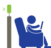
ACCESO AL SALÓN DE LA AEROLÍNEA