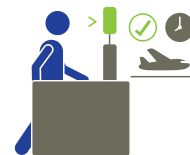
EMBARQUE DE AUTOSERVICIO